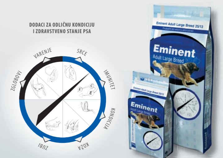
Pakovanje 3 kg, 15 kg

Pileće meso (26 %), kukuruz, pirinač, ostale žitarice, živinska mast (4 %), esencijalne aminokiseline (lizin i metionin), kokosovo ulje, riblja mast, semenka lana, mesnati deo repe, mananoligosaharidi (MOS), kompleks vitamina i mikro sastojaka, helat mangana, cinka i selena, hondroitin i glukozamin, L-karnitin.