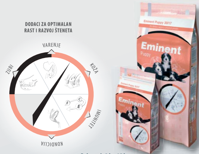
Pakovanje 3 kg, 15 kg

Pileće meso (31 %), kukuruz, pirinač, ostale žitarice, živinska mast (8 %), riblje meso, esencijalne aminokiseline (lizin i metionin), kokosovo ulje, riblja mast, semenka lana, mesnati deo repe, mananoligosaharidi (MOS), kompleks vitamina i mikro sastojaka, helat cinka i selena.