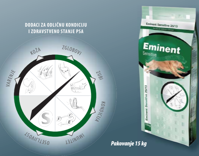
Pakovanje 15 kg

Pileće meso, kukuruz, pirinač, živinska mast, esencijalne aminokiseline (lizin i metionin), vlakno repe, kompleks vitamina i mikro sastojaka, helat cinka i bakra.