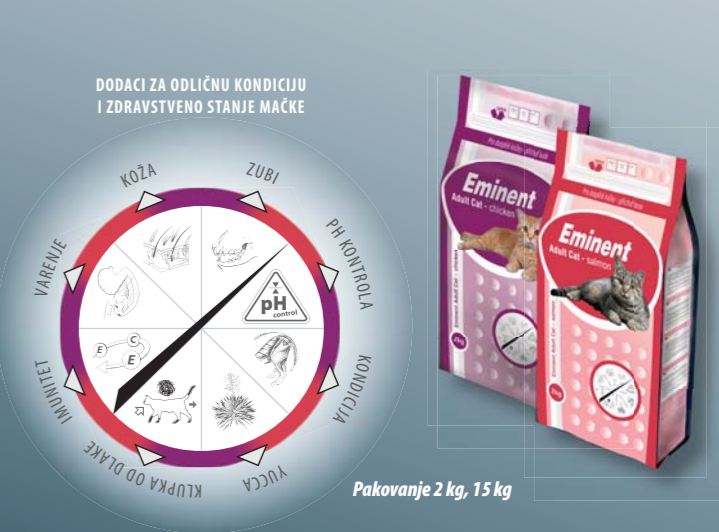
Pakovanje 2 kg, 15 kg

Pileće meso (27 %), kukuruz, pirinač, živinska mast (5,5 %), riblje meso, esencijalne aminokiseline (lizin, metionin), riblja mast, semenka lana, vlakno repe, biljna vlakna, kompleks vitamina i mikro sastojaka, taurin, Yucca schidigera.