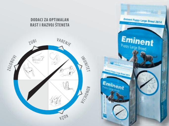
Pakovanje 3 kg, 15 kg

Pileće meso (28 %), kukuruz, pirinač, ostale žitarice, živinska mast (4,5 %), riblje meso, esencijalne aminokiseline (lizin i metionin), kokosovo ulje, riblja mast, semenka lana, mesnati deo repe, mananoligosaharidi (MOS), kompleks vitamina i mikro sastojaka, helat mangana, cinka i selena, hondroitin i glukozamin.