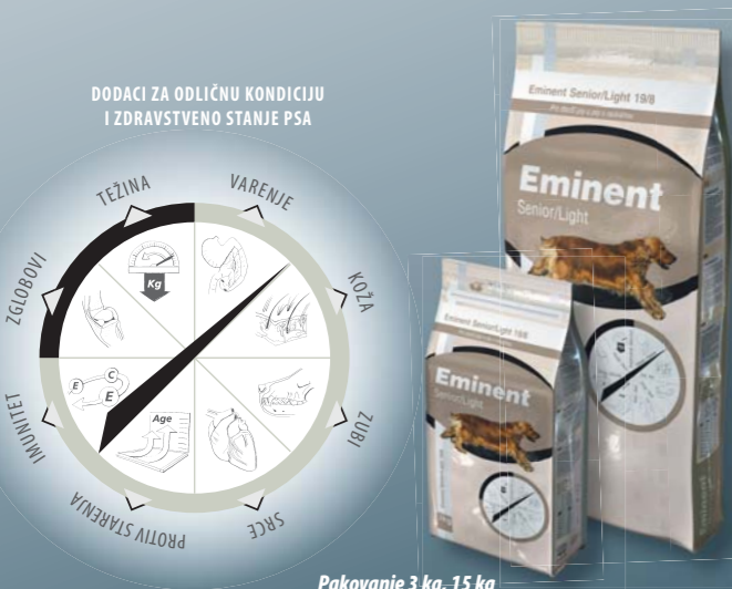
Pakovanje 3 kg, 15 kg

Pileće meso (19 %), kukuruz, pirinač, ostale žitarice, živinska mast, esencijalne aminokiseline (lizin i metionin), kokosovo ulje, riblja mast, semenka lana, vlakno repe (2 %), mananoligosaharidi (MOS), kompleks vitamina i mikro sastojaka, helat mangana, cinka i selena, hondroitin i glukozamin, konjugovana kiselina linolna (CLA), L-karnitin.