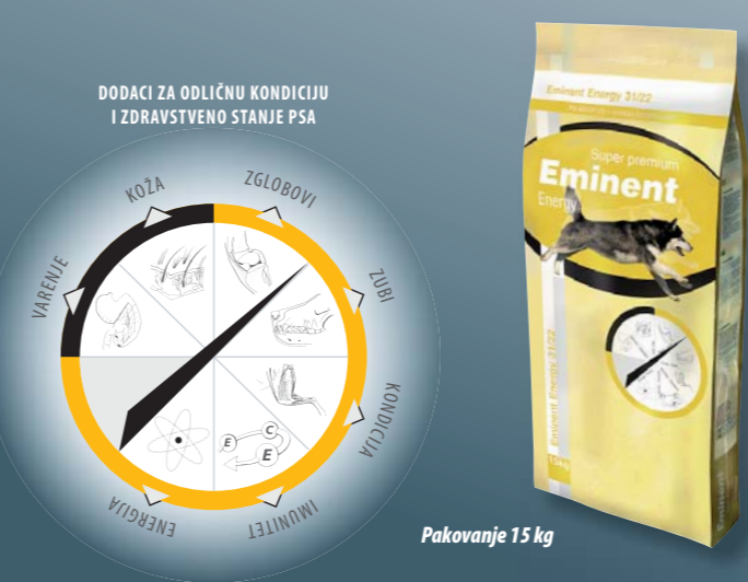
Pakovanje 15 kg

Pileće meso, kukuruz, pirinač, živinska mast, riblje meso (losos), esencijalne aminokiseline (lizin i metionin), mesnati deo repe, kvasac, fruktooligosaharidi (ekstrakt cikorije), ekstrakt novozelandske dagnje, kompleks vitamina i mikro sastojaka, helat cinka i bakra.